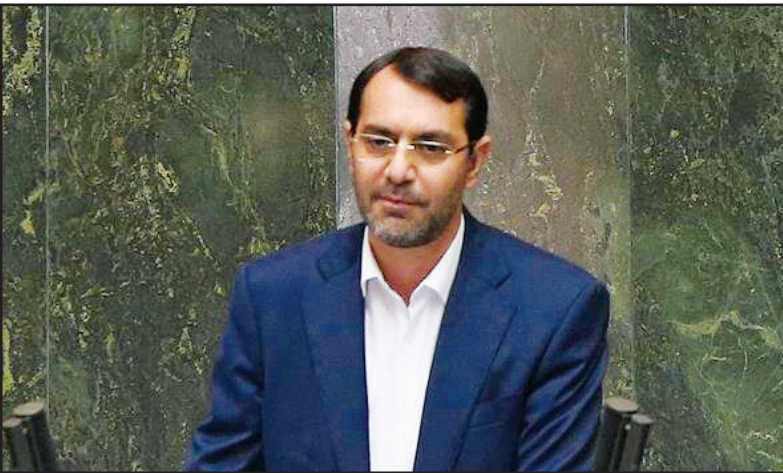
رئیس جمهور در جلسه شورای اداری استان ایلام؛

وی افزود: کمیسیون بر نامه بودجه اخیرا جلسه ای با رئیس سازمان بر نامه و بودجه برگزار کرد و در