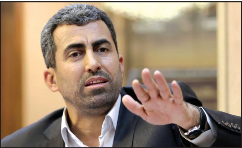
واردات استفاده کرد.

واردات مشروط خودرو و بازار را رقابتی می‌کند