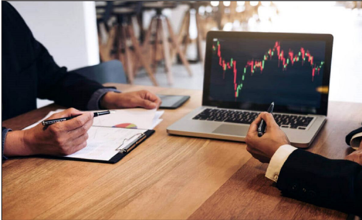
حمایت نشان از قدرت آن دارد. خط ضرب ۵۰ فیبوناچی نیز با این حمایت انطباق دارد که قدرت آن را تشدید می‌کند. اما در حال حاضر شاخص فرابورس توانسته است این حمایت را بشکند و نزول نماید که دلایلی قوی برای تشدید ریزش است. او افزود: پس به صورت کلی و با دید میان مدت، در شاخص فرابورس شاهد

او بیان کرد: تحلیل کانال نیز ابزاری بسیار معتبر برای تشخیص وضعیت روند با در نظر گرفتن نوسانات مختلف آن است.